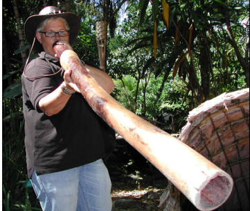
■ Aboriginaalien käyttämä, ontosta puusta tehdyn ”Diggerdoo” soittaminen ns. kiertolihahengitystekniikalla ei ole helpoaa!

Taivaalle ilmaantuu tummaa pil-viä. Lämmin tuuli tuuvertaa na-vakasti rantakadulla ja tekee rantaan vyöryvistä aalloista vaahtopäitä. Juoksen nautiskellen