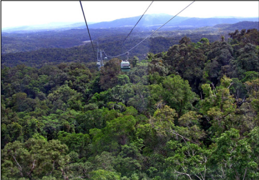
■ Gondolihissi vie 7.5 km:n retkelle sademetsän ylle.