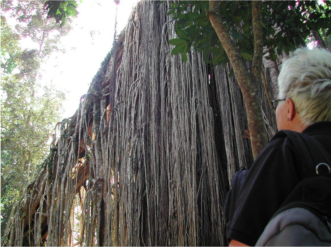
■ Curtain Fig Tree –kuristajaviikunan ilmajuuristo on levittäytynyt 39 m leveäksi ja 15 metriä korkeaksi, vuolasta vesiputosta muistuttavaksi seinämäksi.