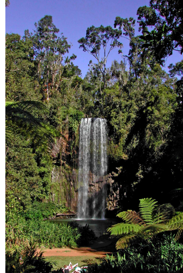
■ Milaa Milaa -kyllän vesiputous on täydellinen luonnonkauneuden työssä, mielikuviin Eden. Vesivierho putoaa noin 50 metrin matkan kauniiseen pyörään viertävävetiseen lampen, jota puut, pensaat ja jättiläissaniaiset reunustavat.