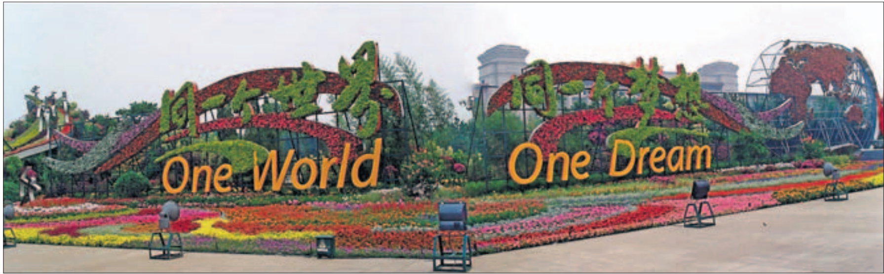
Oheinen kukista ja pensaista muotoiltu liki 100-metrinen ja parikymmentä metriä korkea taideteos Taivaallisen rauhan aukiolla oli mykistävä. Oikeassa reunassa kukilla koristeltu maapallo.

Palvelemme sinua numerossa 016 3232 . Rovaniemi - Ylläs - Levi - Olos - Pallas - Hetta - Saariselkä - Kilpisjärvi