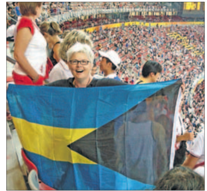
Bahamalaisfani. Taustalla hymyilevä turvamies.

Päättäjien suurimpiin elämyksiini kuului olympiamitalin vähittäinen hahmottuminen kentälle urheilijoiden keskelle. Suomen joukkue kuvan oikeassa alapuoliskossa vaaleansinisissä asuissa.