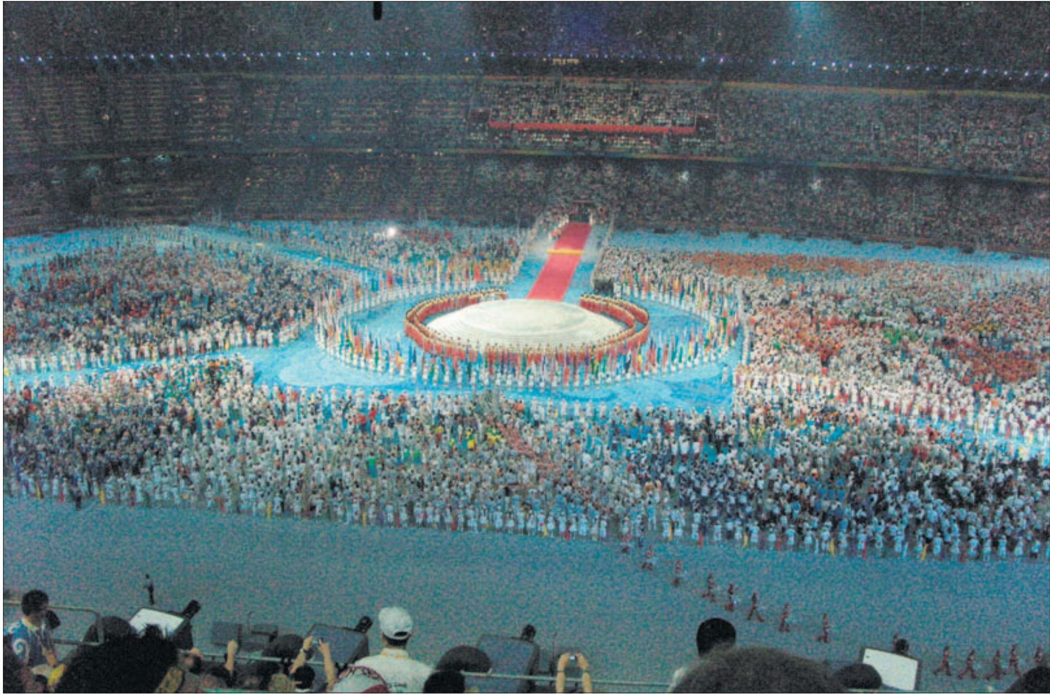
Päättäjien suurimpiin elämyksiin kuului olympiamitalin vähittäinen hahmottuminen kentälle urheilijoiden keskelle. Suomen joukkue kuvan oikeassa alapuoliskossa vaaleansinisissä asuissa.