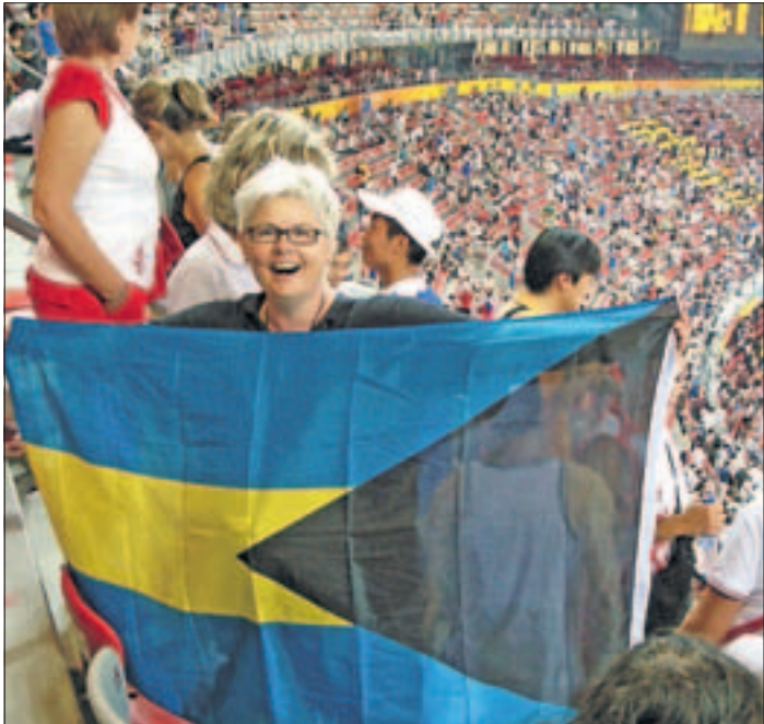
Bahamalaisfani. Taustalla hymyilevä turvamiest.

Olympiastadionin alueella vallinnut leppoisa tunnelma taustamusiikkeineen jätti hyvän olotilan. Päättöseremonia huipentui lauluun ”Hard to Say Goodbye” (vaikeaa jättää hyvästit). Se kuvaa osuvasti kisojen jälkeistä haikaa olotilani.