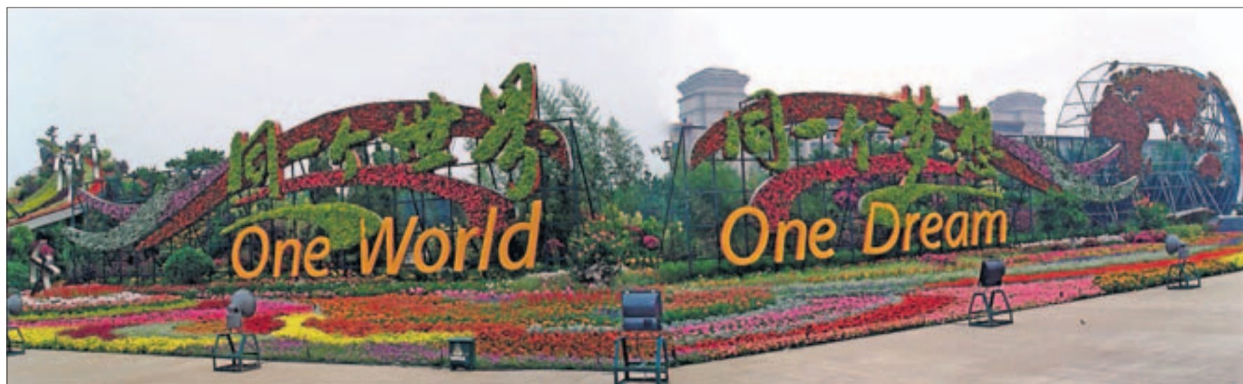
Oheinen kukista ja pensaista muotoiltu liki 100-metrinen ja parikymmentä metriä korkea taideteos Taivaallisen rauhan aukiolla oli mykistävää. Oikeassa reunassa kukilla koristeltu maapallo.

Olympiastadionin alueella vallinnut leppoisa tunnelma taustamusiiikkeineen jätti hyvän olotilan. Päättösseuramonia huipentui lauluun ”Hard to Say Goodbye” (vaikeaa jättää hyvästit). Se kuvaa osuvasti kisojen jälkeistä haikaa olotilaa.