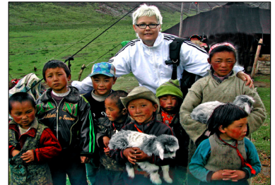
■ Nomadilapsia jurtta-leikkikylässä Tiibetin ylängöllä (5135 m mpy.)