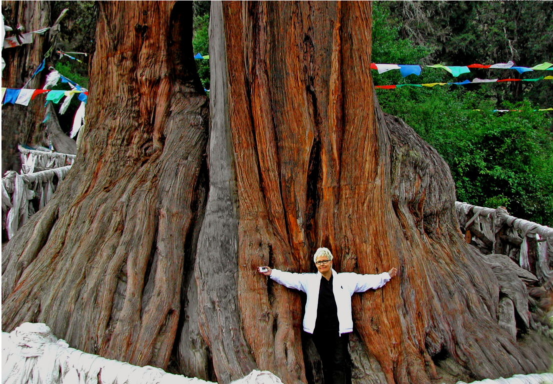
■ Kuningassypressi (King of Cypress) on Kiinan suurin puu. Sen sanotaan olevan myös Tiibetin buddhalaisuuden (lamalaisuuden) perustajan Shinrab Miban "elämänpuu".