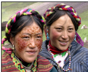
■ Tiibetiläistyttöjä Yamdro-järvellä

Onnettomuudesta kehittyvä erikoinen näytös päätettiin skootterimme, kuljettajamme sekä onnettomuutta tutkivat kaksi poliisia, yleisönä retkiporukamme ja parisataa kyläläistä sekä taustalla satumaisen kaunis maisema. Koska kukka paikkailista ei puhu englantia, katselemme uteliaina toisiamme.