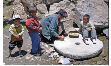
■ Maailman ylinpiiriin kuuluvan metsikön kupeessa on kyläyhteisö, jossa eletään yksinkertaista elämää.