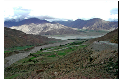
■ Tyypillinen Tiibetin ylängön tai "Maailman katon" laaksonäkymä.