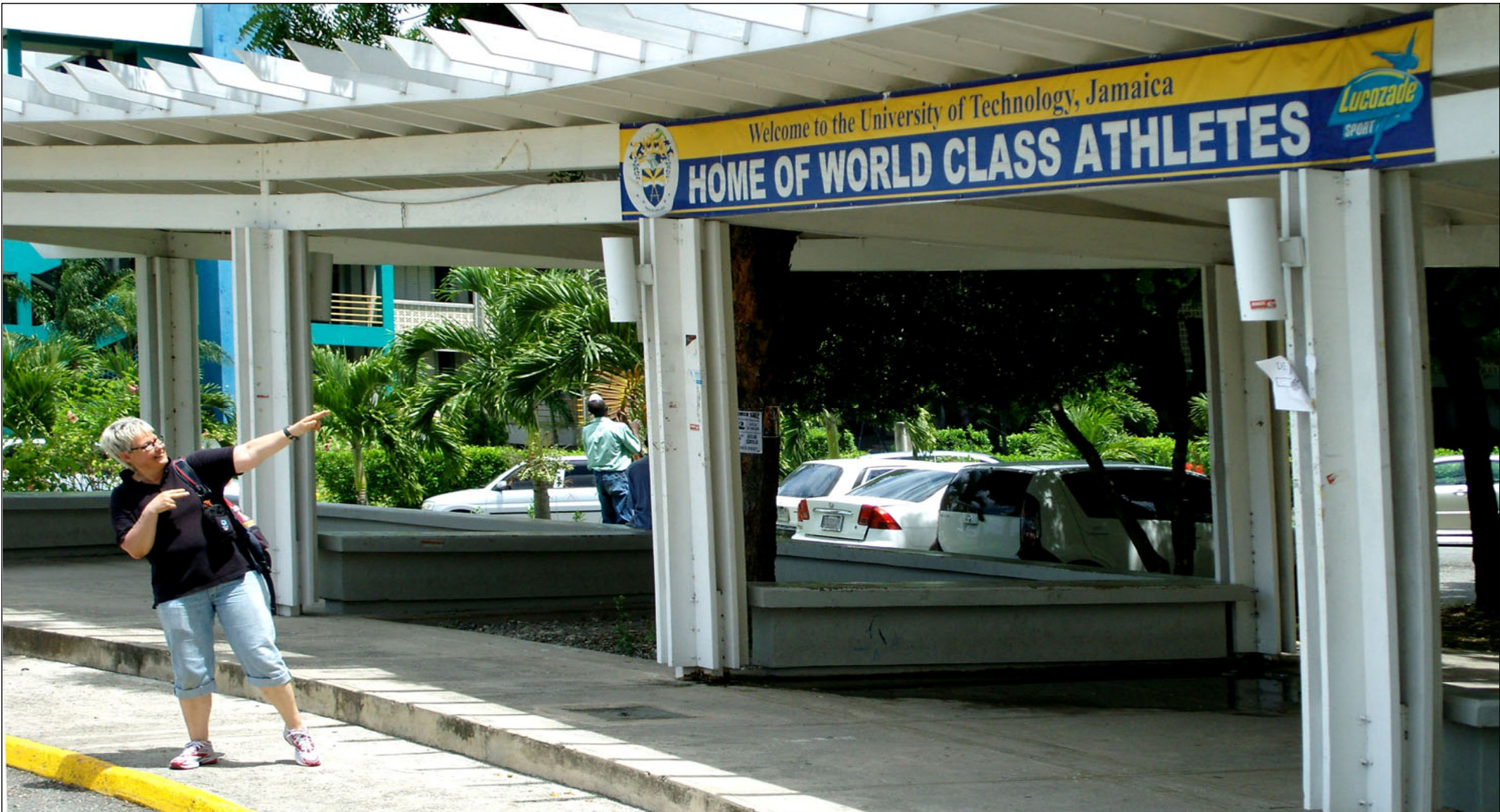
Jamaikan teknillinen yliopisto UTECH on maailmanluokan urheilijoiden "koti".