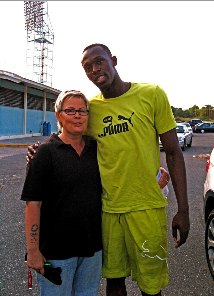
Usain lähettää tässä terveiset kaikille suomalaisille lapsille!