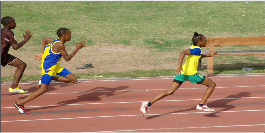
Jamaikan nopeimmat lapset harjoittelevat yhdessä idoleidensa kanssa. Tällä kertaa ei edes Usain ehtinyt samaan kuvaan!

Jamaikalaisten geeniperimästä arvioidaan kolme neljännestä olevan länsiafrikkalaista alkuperää, viidennes eurooppalaisten ja afrikkalaisten jälkeläisiltä. Usain Boltin lihaksistosta arvelaan olevan kolmanneksen verran länsiafrikkalaista alkuperää olevia erittäin nopeita lihassoluja.