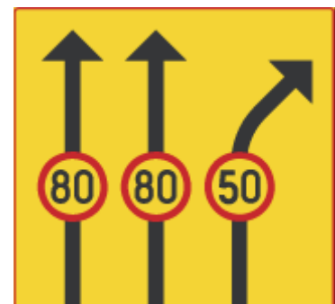
Eläkeläisten ja keski-ikäisten erottelualue?