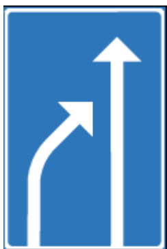
Kylkeen kiilaavia idiootteja?